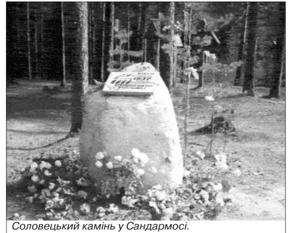
Соловецький камінь у Сандармосі.

Це були люди, які могли б створити неоціненні духовні скарби, володіючи якими, ми, українці, стали б урівень з іншими цивілізованими народами. Сама присутність таких людей у суспільстві робить його кращим. Але постріли малограмотного, але кваліфікованого розстрільника капітана Михайла Матвеева – виконавця волі чужої, глибоко ворожої