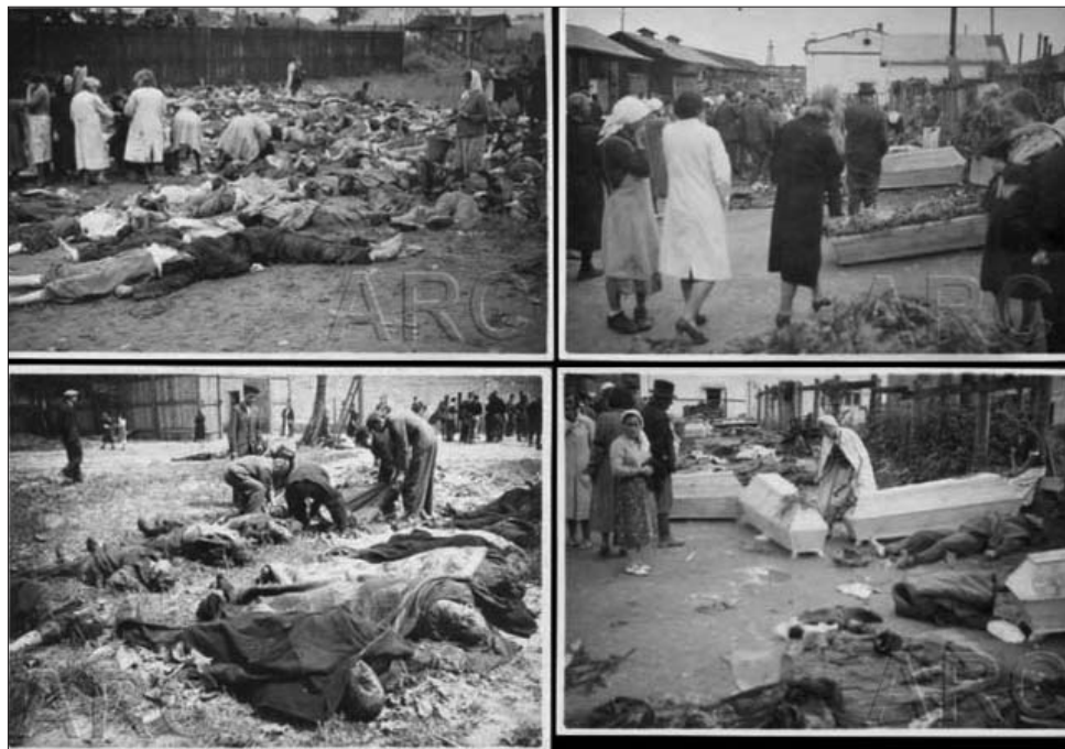
Жертви НКВС на тюремних підвір'ях на вулицях Лонцького та Замартинівській у Львові. Червень 1941 р.

банням: створити, нарешті, шкільні й вузівські підручники історії, у яких темі політичних репресій і, зокрема, Великому Терору, було б відведене місце, що відповідає їхньому історичному значенню. Історія радянського терору повинна стати не тільки обов'язковою й значною частиною шкільного навчання, а й об'єктом серйозних зусиль у галузі народної освіти в найширшому розумінні цього слова. Необхідні просвітні й культурні програми, присвячені цій темі, на державних каналах телебачення, необхідна державна підтримка видавничих проєктів щодо видання наукової, просвітньої, мемуарної літератури, присвяченої епосі Терору.