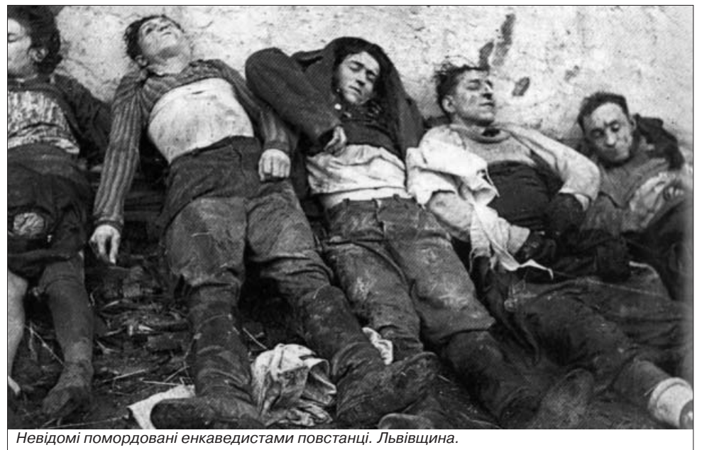
Невідомі помордовані енкаведистами повстанці. Львівщина.

Але, незважаючи на всю жорстокість тодішнього режиму та паплюження національно-визвольного руху в Україні, населення жертвовно підтримувало його, як тільки могло. Це дуже добре розуміли окупанти, а тому весь час намагалися за всяку ціну розірвати зв'язки українських громадян з визвольним рухом. Щоб досягти своєї мети, крім терору проти населення, вони другого виходу не бачили. Саме тому по селах, містах проводилися масові облави із участю багатотисячних загонів спецвійськ НКВС, озброєних найновішою зброєю та військовою технікою. При цьому проводилися масові арешти, застосовувалися жорстокі садистські побори, тортури, розстріли, спалювання сіл, грабежі та гвалтування. Таких страхіть в світовій історії не зазнала жодна країна