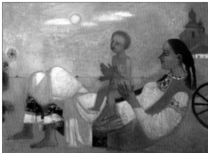
Віктор ГОНТАРІВ. Народження, 2006 (полотно, олія)

Отже, всіх українців, які бажають долучитися серцем до основ буття свого народу, організатори запрошують приєднуватися до священної справи та брати участь у фестивалі.