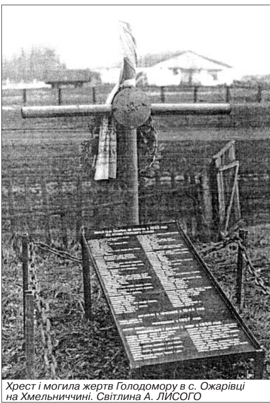
Хрест і могила жертв Голодомору в с. Ожарівці на Хмельниччині.