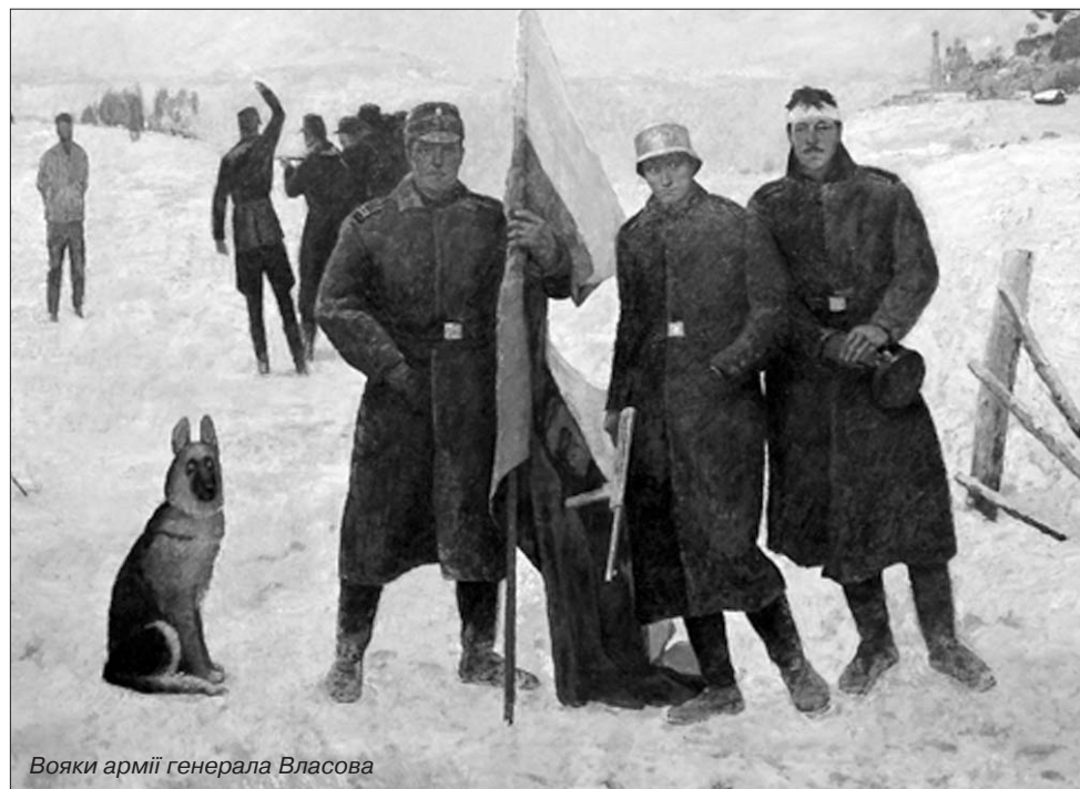
Вояки армії генерала Власова

раціях на теренах Білорусії. Під час розмови було досягнуто ряд домовленостей про перехід бригади під командування військ СС. Бригада Камінського була переформована в штурмбригаду СС "РОНА", а він сам отримав чин Ваффен-бригаденфюрера та генерал-майора військ СС. 1 серпня 1944 року за наказом головного оперативного управління СС штурмбригаду СС "РОНА" перейменовано на 29-ту військово-гренадерську дивізію СС (русская №1). Полки бригади переформували в три номерних полки СС і різноманітні служби підтримки.