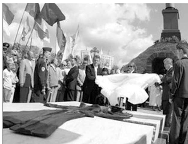
25 серпня 2006 року. Президент України Віктор Ющенко відкриває у Крутах на Чернігівщині пам'ятник київським юнакам, які загинули під час захисту підступів до Києва від більшовицьких військ у січні 1918.