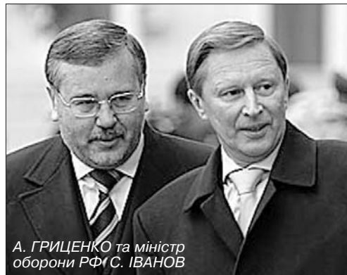
А. ГРИЦЕНКО та міністр оборони РФ І. СЕРГЕЄВ

На прикладі Гриценка чітко видно, до чого може призвести вражене самолюбство чиновника, який не зумів піднятися до висоти державницького бачення. Ображений на Президента за те, що той його звільнив, він не лише "виторгував" собі посаду голови комітету Верховної Ради з питань безпеки та оборони, а й почав відверто і цинічно критикувати главу держави. Спершу, коментуючи виступ Президента щодо необхідності підвищення боєздатності армії, він заявив, що Віктор Ющенко, мовляв, не розуміє ні армії, ні реформ, які в ній відбуваються. "Можливо, тому рівень довіри до армії в суспільстві багатократно перевищує рівень довіри до Верховного головнокомандувача", – саркастично зауважив Гриценко. При цьому він забув про те, що на останніх парламентських виборах лише 10% військовослуж-