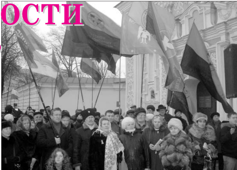
Софійська площа Києва. 22 січня 2008 року

великий День. День територіальної цілісності. День історичної і національної єдності. День об'єднання всіх людей нашої землі, – наголосив Віктор Ющенко, звертаючись до присутніх та до всього українського народу. – Наступного року ми відзначимо 90-ліття Дня Соборності. Він повинен, нарешті, стати повноцінним державним святом. Таку ініціативу я вношу на розгляд Верховної Ради України і впевнено вірю в її підтримку". Віддавши належну шану всім провідникам і творцям української державності початку ХХ століття, Президент України зосередився на завданнях найближчого майбуття. З-поміж них єдність він виокремив як спільну дію, що спрямована у майбутнє. "2008 року ми повинні консолідувати всі можливі державні, політичні, ділові та суспільні сили, щоб перевести енергію протистоянь в енергію творення