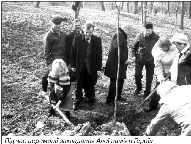
Під час церемонії закладання Алеї пам'яті Героїв