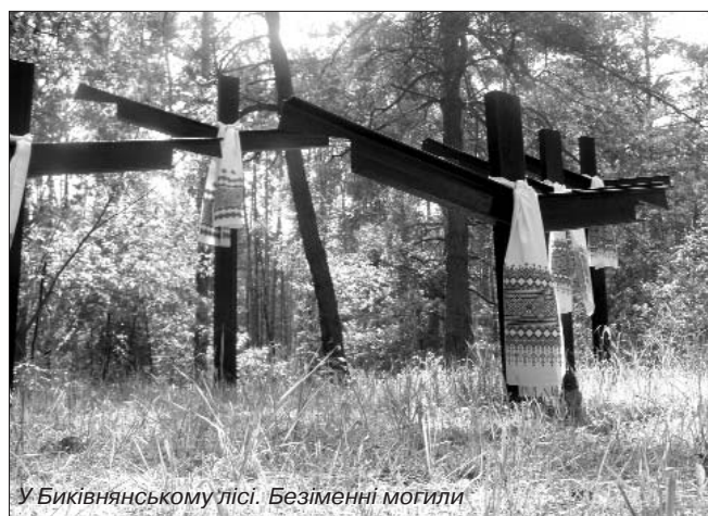
У Биківнянському лісі. Безіменні могили

У своєму виступі глава держави дав оцінку комуністичному режиму, який існував в Україні понад 70 років. "Злочинна комуністична влада, для якої нічого не значили не тільки людські права, а й сама людина, – сказав Президент, – жорстоко і цілеспрямовано нищила цвіт нашої нації. Кожен, хто вирізнявся талантом, в чий душі горів живий вогонь, першим потрапив під налагоджену машину репресій. Любов до України, до рідного народу стала в ті часи найтяжчим із злочинів. Репресії проти українців почалися ще до 30-х років і продовжувалися навіть після розвінчання культу особи Сталіна".