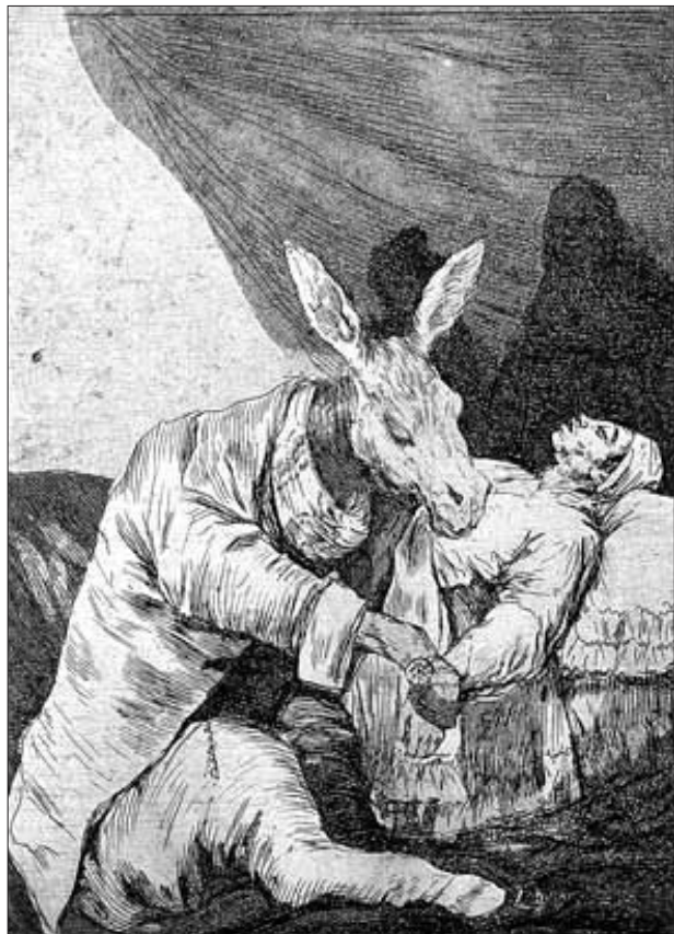
Франциско ГОЙЯ. КАПРИЧОС. Офорт.

Розпещена "легким" мистецтвом публіка XVIII ст. була добряче шокована, коли на свіжовиддрукованих офортах королівського художника замість традиційних пухляких рожевоощих пастушок, яких так полюбили зображати тодішні мистці, виявилися потворні баби-звідниці, каліки-жебраки, влучні повії, вкриті плямами плульських захворювань, огидні карлики-горбані, осли в ролі вчителів, лікарів, музикантів (ніби їх і зараз нема) тощо. Але ще більшого страху наводили зовсім незвичні,