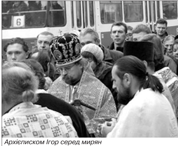
Архієпископ Ігор серед мирян

тичність – поняття багатовимірне. У нього входить і пізнання радості бути українцем. Радості від того, що ти є сам собою, а не граєш чийсь роль.