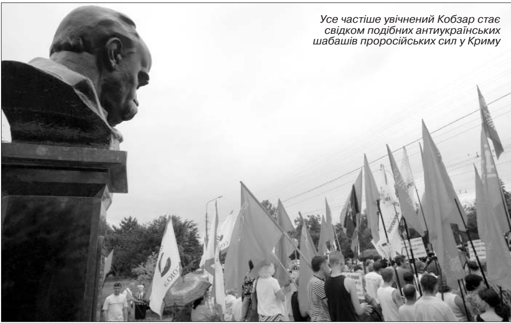
Усе частіше увічнений Кобзар стає свідком подібних антиукраїнських шабашів проросійських сил у Криму