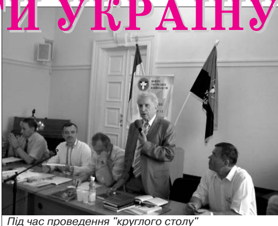
Під час проведення "круглого столу"

Передусім постає чимало питань щодо відстоювання національних інтересів у системі панування глобального капіта-