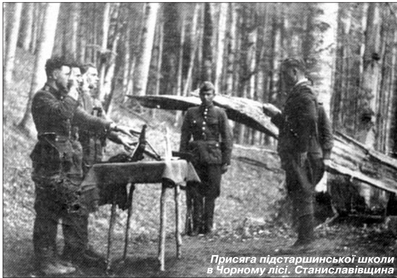
Присяга підстаршинської школи в Чорному лісі. Станіславщина