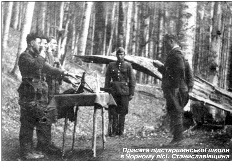
Присяга підстаршинської школи в Чорному лісі. Станіславщина

Переповідали, що згодом "Жук" зі своєю боївкою обеззброїв підрозділ мадярів з 12 осіб. Це сталося на залізничній колії між станціями Цумань і Клевань. Мадяри вдень робили обхід залізничної групи. Коля проходила через ліс, в яко-