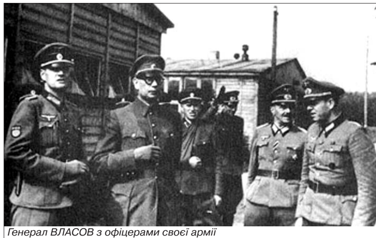
Генерал ВЛАСОВ з офіцерами своєї армії

Чому ж це Сталін так хотів сподобатися німцям? Чому прагнув максимально подовжити альянс з Гітлером? Чого варті одні лише вислови тодішніх радянських керівників. Ось з промови Молотова на V сесії Верховної Ради СРСР: "Не тільки безглуздо, а й злочинно вести таку війну, як війна за знищення гітлеризму, котра прикривається фальшивим прапором боротьби за "демократію". А ось Сталін: "Я знаю, як неміцький народ любить свого фюрера. Я хотів би поетому выпить за его здоровье". Це з його слів під час банкету з Ріббентропом 23 серпня 1939 р. на честь підписання радянсько-німецького пакту про ненапад і