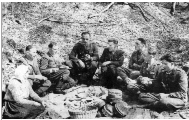
Вояки УПА. Великдень. 1949 р., Гуцульщина

Виставку розроблено на основі матеріалів Галузевого державного архіву