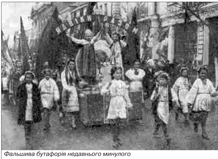
Фальшива бугафорія недавнього минулого

Тому українські організації Росії пропонують розглянути можливість створення в одній з установ, що належать Україні на