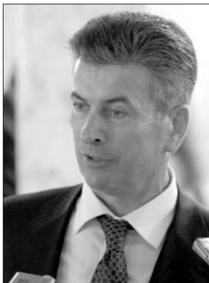
Політики, безпосередньо причетні до скасування в наших паспортах графи "національність"

одній владі когось записали тим, а прийшла інша – записали іншим і так далі. Ця графа не потрібна в паспорті. (Оплески).