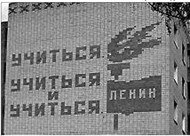
Гасла подібного змісту ще й досі прикрашають фасади будинків у містах незалежної України.

Міф третій: Тут поширюються чутки, що перейменування вулиць створить масу незручностей, проблем для їх мешканців. У різних газетних статтях, на зібраннях ветеранів, пенсіонерів і навіть голів квартальних комітетів проходять дискусії, щоб не допустити цього кроку. За "вагомий аргумент" береться той факт, що ніби при перейменуванні вулиць потрібно буде заплатити з