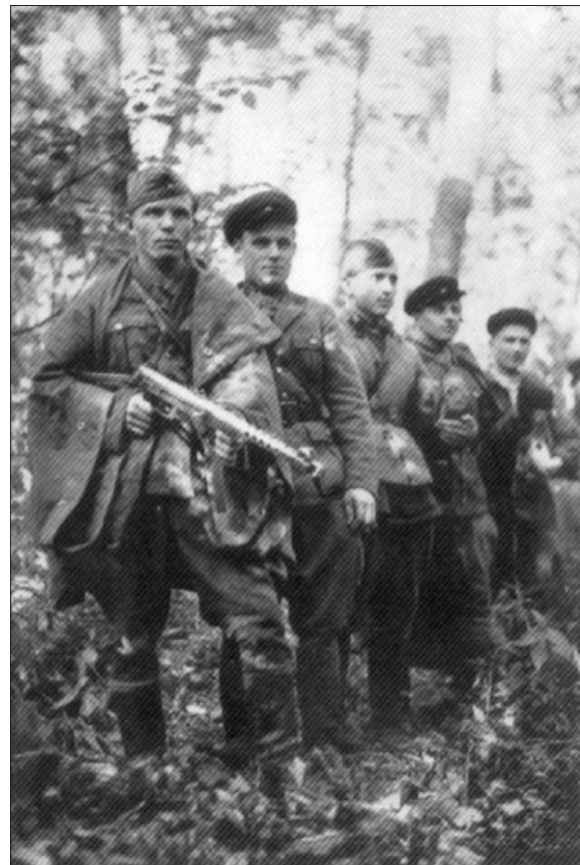
кличке "Олень". Общее руководство ОУН по Широковскому району осуществлялось криворожским окружным проваодом во главе с представителем главного проваода, прибывшим из Западной Украины по кличке "Мирон Орлик".

Широковский район Националистическая деятельность организации направлялась представителем криворожского окружного проваода, по