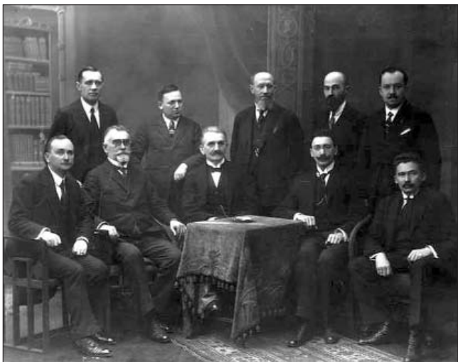
Уряд ЗУНР. Відень, 1920 рік

Президент України Віктор Ющенко взяв участь в урочистостях з нагоди 90-ї річниці утворення Західно-Української Народної Республіки, що відбулися у Львові. Зокрема, він виступив з вітальною промовою в оперному театрі ім. С. Крушельницької на святочній Академії.