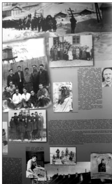
Один з експонатів виставки

3 29 жовтня до 6 листопада у Дніпропетровському історичному музеї ім. Дмитра Яворницького пройшла фотовиставка, присвячена боротьбі Української Повстанської Армії за волю України.