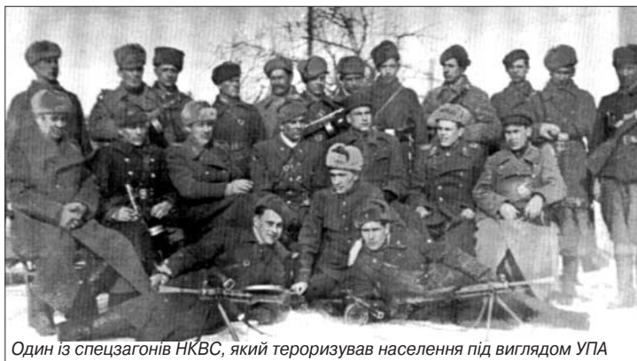
Один із спецагонів НКВС, який тероризував населення під виглядом УПА

Але український національний дух був заплямований, забруднений відвертою московсько-комуністичною брехнею.