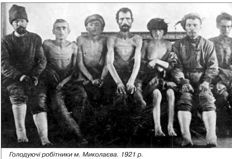
Голодуючі робітники м. Миколаєва. 1921 р.

меморіал загиблим у 1932–33 роках. А про тих, кого не стало на цім світі, "завдячуючи" особисто "вічно живому" Ульянову (Леніну), забуваємо? Спробуємо нагадати.