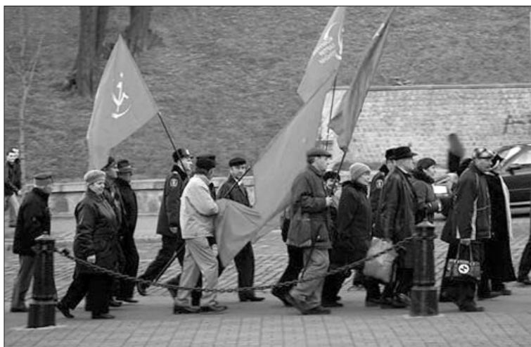
Старшим людям на одному місці довго не стоялося: Арсенальна – Майдан Незалежності – Секретаріат Президента

і Молодий Рух влаштували театралізоване дійство, в якому українська молодь вимітала комунізм і червоних комісарів з української землі. П'ятеро людей, одягнутих у жовто-голубі поліетиленові плащі, виганяли мітлами чоловіка, вдягнутого в шапку-вусапанку з великою червоною зіркою і плащ, з написом "Комунізм – чума ХХ століття".