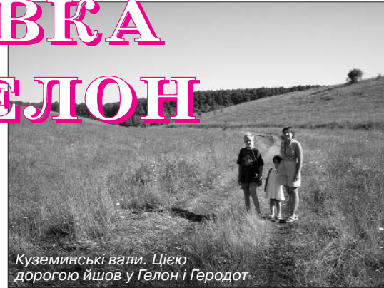
Куземинські вали. Цією дорогою йшов у Гелон і Геродот

З тою церквою теж пов'язано чимало цікавих історій: кажуть, що її будували тричі, але першого разу вона згоріла, тоді почали відбудовувати, і вона згоріла знову, – а все через те, що будувати її кликали "москалів", а "москалі мають біса в носі, і їх до святої справи допускати не можна". Відтак збудували вже на іншому місці, й там вона стояла така велична й красива, що аж! Проте й там були свої історії: кажуть, що дванадцять священників померли в ній буквально один за одним, і припинилося це аж тоді, коли після першого в ХХ столітті відновлення Української