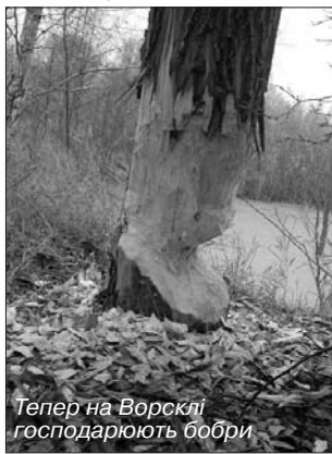
Тепер на Ворсклі господарюють бобри