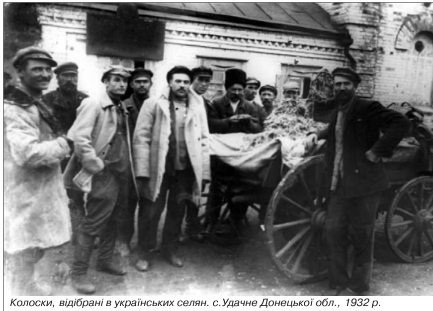
Колоски, відібрані в українських селян. с. Удачне Донецької обл., 1932 р.

Голод був використаний як інструмент знищення українського опору та економічної незалежності українських господарств. Це й підтверджує постанова ЦК ВКП(б) від 14 грудня 1932 р., у якій йшлося про проведення хлібозаготівель та "правильне проведення українізації", що фактично означало ліквідацію