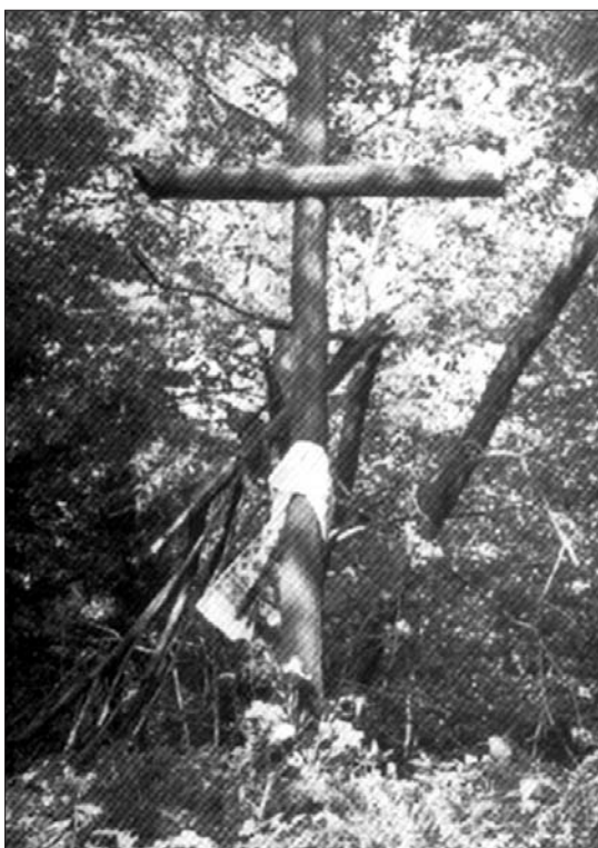
Могила в селі Воля Володзька, де поховано 120 вояків УПА.

збив скриньку, положили туди набрякле тіло і стали чекати.