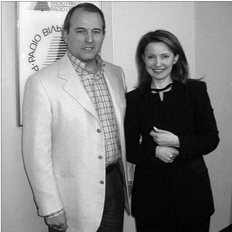
Фото на довгу пам'ять після передвиборних дебатів 2002 року у студії української служби радіо "Свобода"

Тим часом у пресі почали з'являтися повідомлення, в які попервах було важко повірити – про зближення між, здавалося б, непримиренними антагоністами – Медведчуком і Тимошенко. Одним із перших про це публічно заявив багато знаючий лідер СПУ Мороз. Навесні минулого року, в одному із своїх інтерв'ю, він зокрема багатозначно зазначив: "Я не знаю, наскільки без-