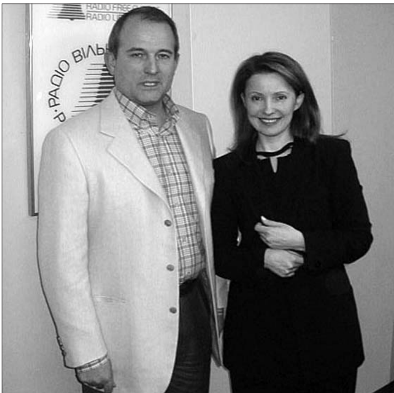
Фото на довгу пам'ять після передвиборних дебатів 2002 року у студії української служби радіо "Свобода"

Тим часом у пресі почали з'являтися повідомлення, в які попервах було важко повірити – про зближення між, здавалося б, непримиренними антагоністами – Медведчуком і Тимошенко. Одним із перших про це публічно заявив багато знаючий лідер СПУ Мороз. Навесні минулого року, в одному із своїх інтерв'ю, він зокрема багатозначно зазначив: "Я не знаю, наскільки без-