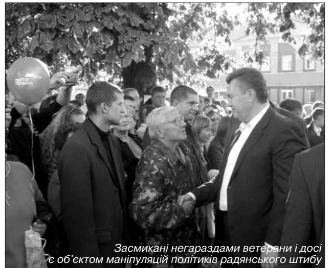
Засмікані негараздами ветерани і досі є об'єктом маніпуляцій політиків радянського штибу

виборців, були члени молодіжної громадської організації "Київський клуб "Червона зірка". Останні приїхали, щоб відтворити події тих часів і подарувати Музею історії Корсунь-Шевченківської битви спорядження бійця Червоної армії, зокрема польове обмундирування. І не варто цим людям нагадувати про те, що у цій видатній, з точки зору радянської історіографії, битві за 24 дні було вбито 770 (!) тисяч радянських людей. І ніхто тепер напевне не скаже, кого серед них було більше: воїнів червоної армії чи українців-чорносвиточників? Тобто, мешканців сіл Черкащини віком від 15 до 55 років, яких мобілізували польові військомати. Їх, ненавчених, погнали на вірну смерть "спокутувати" провину за те, що у 1941 році вони опинилися в окупації. А це вважалося неабиякою провинною. (Те, що українців на поталу ворога покинула, тікаючи, червона армія, нікого не цікавило). Зате і їхніми трупами "геніальний" Жуков зміг