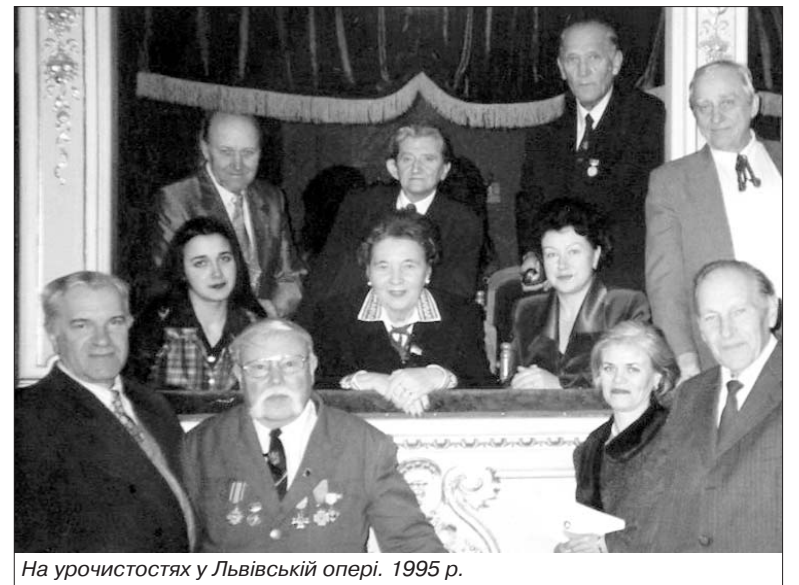
На урочистостях у Львівській опері. 1995 р.

– З останніх подій найнеадекватнішою є відправка у відставку міністра-патріота Володимира Огризка. Звісно, цю справу продумували давно, бо він не влаштував ні регіоналів, ні комуністів, ні більшу частину тимошенківців. Принципова позиція міністра щодо нафто-газових подій та шовіністичних випадів пана Черномірдіна стала ще одним детонатором, який спричинився до голосування. А поведінка Президента наразі є відповідною до ситуації і доволі