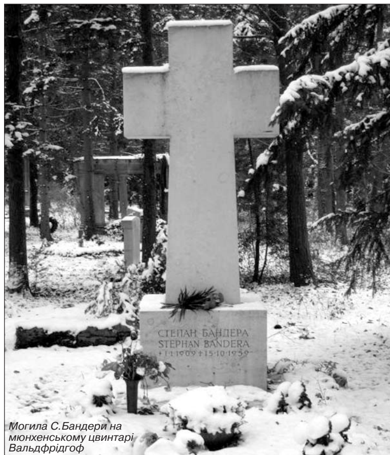
Могила С.Бандери на мюнхенському цвинтарі Вальдфрідгоф

Берлін. Тут "Сергей" висловив йому своє задоволення та захоплення результатами розвідувальних дій у Мюнхені.