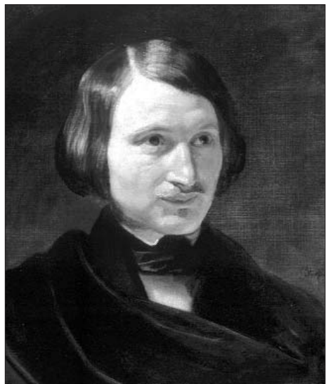
Ф.А.МОЛЛЕР. Рим. Масло, 1840 р.