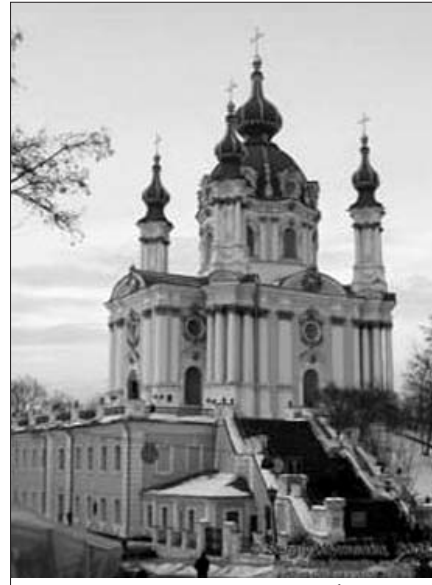
Андріївська церква в Києві побудована за ініціатииви О.Розумовського й імператриці Єлизавети

Олекса отримував високі чини: камергера, генерал-поручика, генерал-фельдмаршала. Він також був відзначений орденом Андрія Первозванного, навіть мав звання графа Римської імперії та посідав чималі маєтності в Росії та Україні. Попри всі привілеї й почесні, Олекса не цурався своєї української родини і рідного поневоленого народу, і цю любов зберіг до кінця свого життя. Ве-