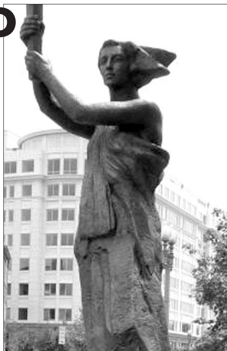
Пам'ятник понад 100 мільйонам жертв комунізму в Світі, встановлений у Вашингтоні.