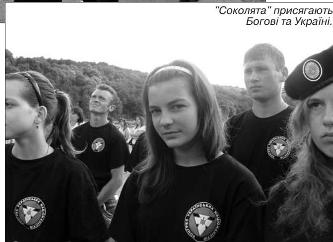
"Соколята" присягають Богові та Україні.

бірські "соколята" долетіли до Зарваниці, терплячи випробування сонцем, спрагою, побутовими незручностями, мозолями. Бо в серці мають віру, у душі – відвагу й любов до України.