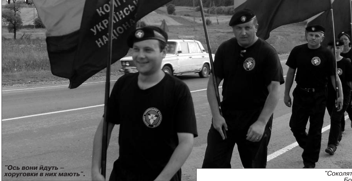
"Ось вони йдуть – хоруговки в них мають".