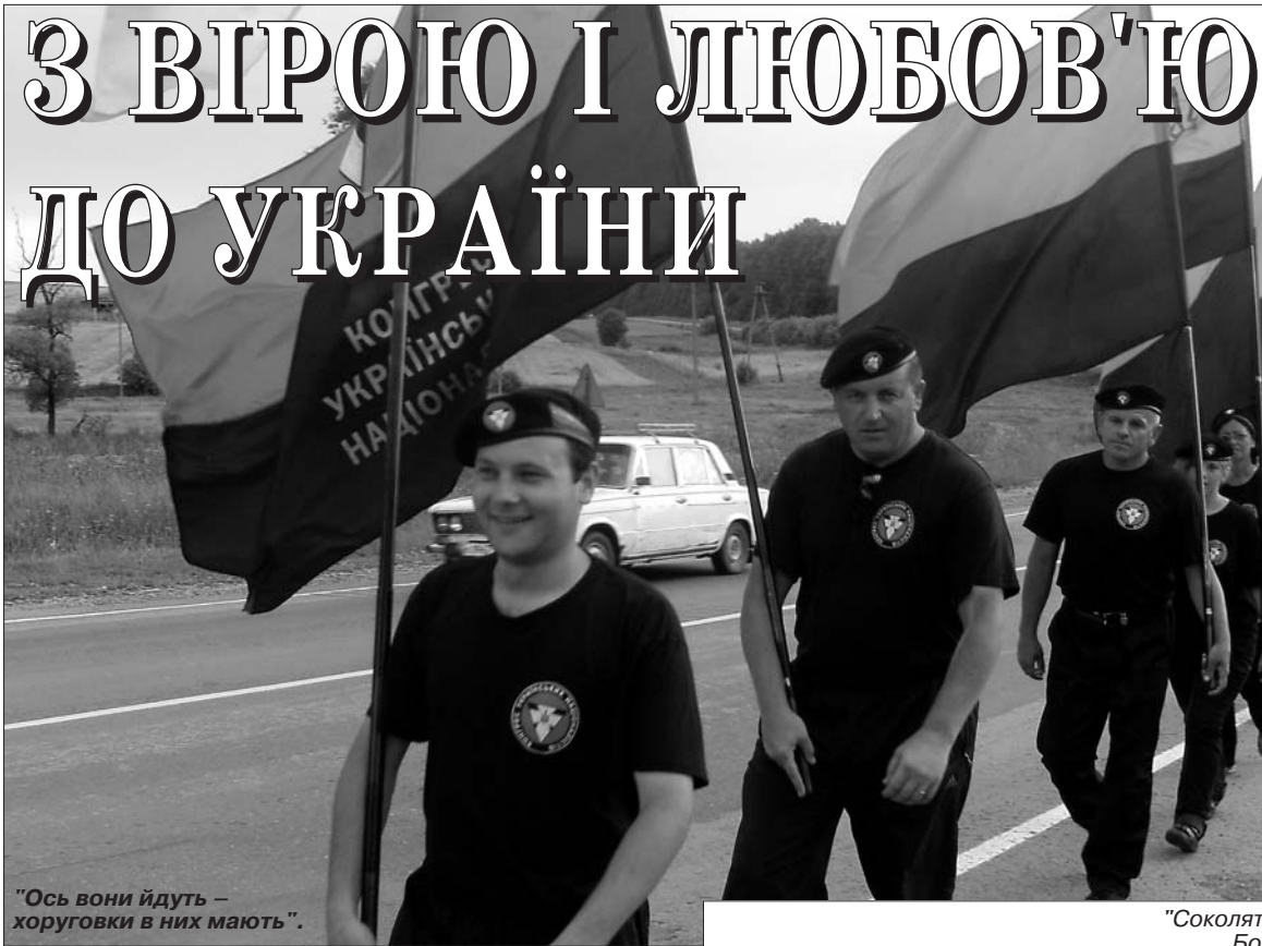
"Ось вони йдуть – хоруговки в них мають".

Старосамбірці зважилися на цю прощу вже вдруге, що правда, минулого року вони дійшли тільки до Зарваниці, нині ж продовжили шлях ще на півтори сотні кілометрів. Як і минулого разу, йду в цій колоні, живу життям прочанки. Часто виходить так, що в колоні під бандерівським прапором йде нас 12 прочан (молоді учасники ходи змінюють один одного). Помітивши цю закономірність,