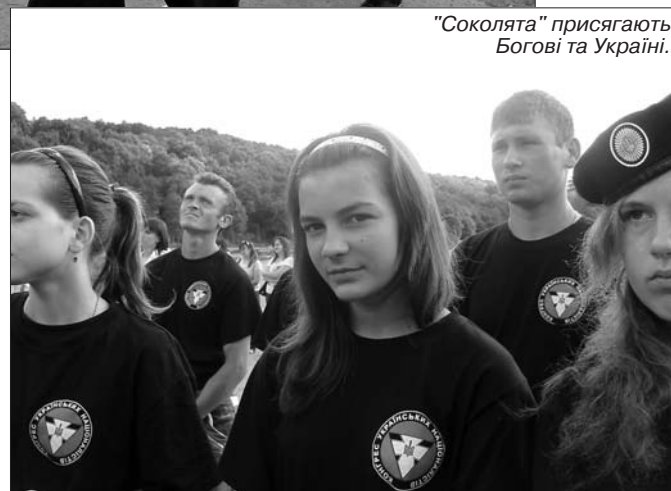
"Соколята" присягають Богові та Україні.

бірські "соколята" долетіли до Зарваниці, терплячи випробування сонцем, спрагою, побутовими незручностями, мозолями. Бо в серці мають віру, у душі – відвагу й любов до України.