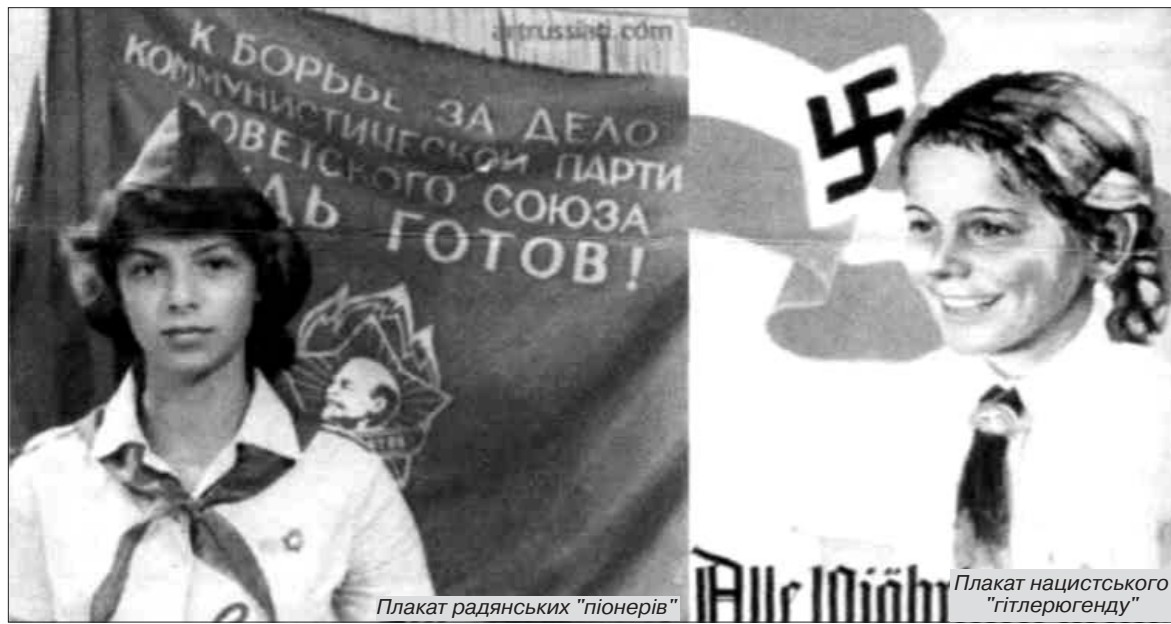
Плакат радянських "піонерів"