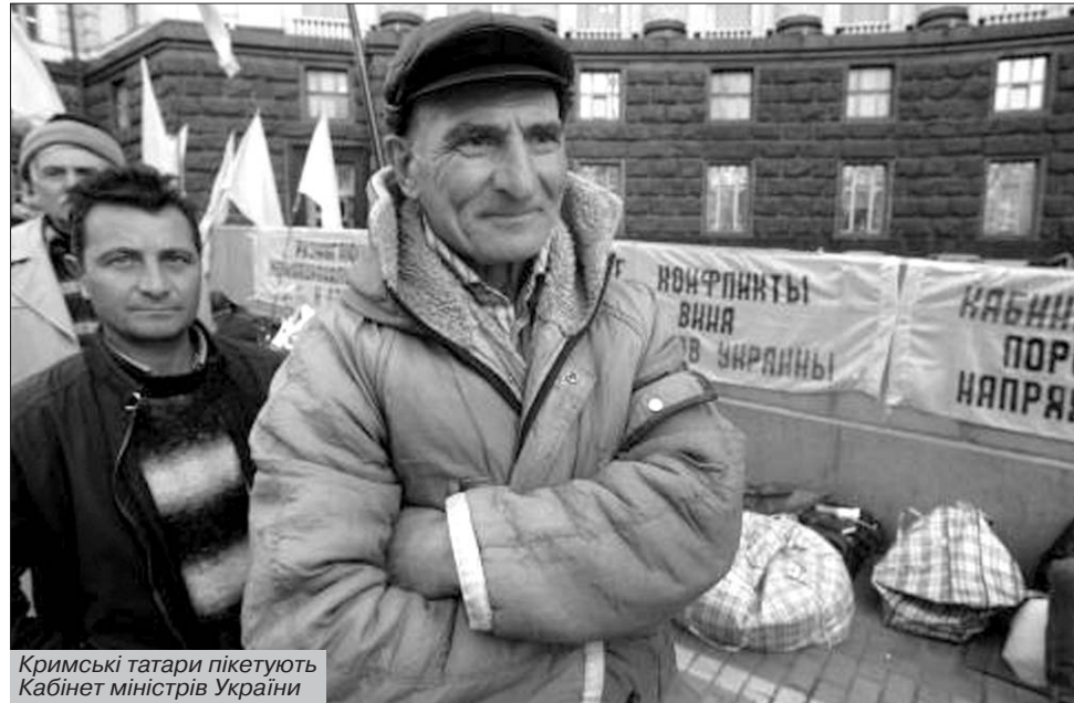
Кримські татари пікетують Кабінет міністрів України

"Трагедія корінного праукраїнського Криму розпочинається з грецької колонізації. Про це розповідає "Влесова книга": "Коли наші пращури Сураж творити почали, греки приходили купцями до торжищ наших, прибутки шукали і, землю нашу розглядаючи, посилали до нас багато своїх юнаків і будинки будували, і гради обміну та торгівлі. І ось одного разу побачили воїнів їхніх при мечях озброєних і скоро нашу землю прибрали до своїх рук. Отак наша земля, яка чотири віки була наша, стала грецька".