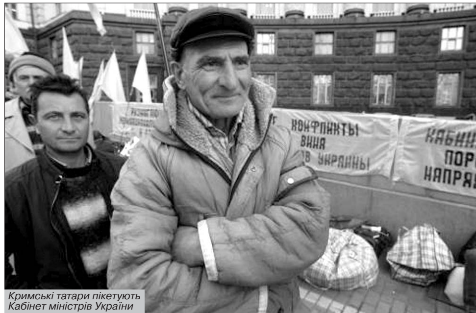
Кримські татари пікетують Кабінет міністрів України

"Трагедія корінного праукраїнського Криму розпочинається з грецької колонізації. Про це розповідає "Влесова книга": "Коли наші пращури Сураж творити почали, греки приходили купцями до торжищ наших, прибутки шукали і, землю нашу розглядаючи, посилали до нас багато своїх юнаків і будинки будували, і гради обміну та торгівлі. І ось одного разу побачили воїнів їхніх при мечях озброєних і скоро нашу землю прибрали до своїх рук. Отак наша земля, яка чотири віки була наша, стала грецька".