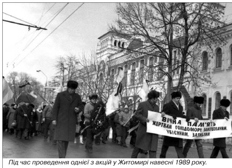
Під час проведення однієї з акцій у Житомирі навесні 1989 року.