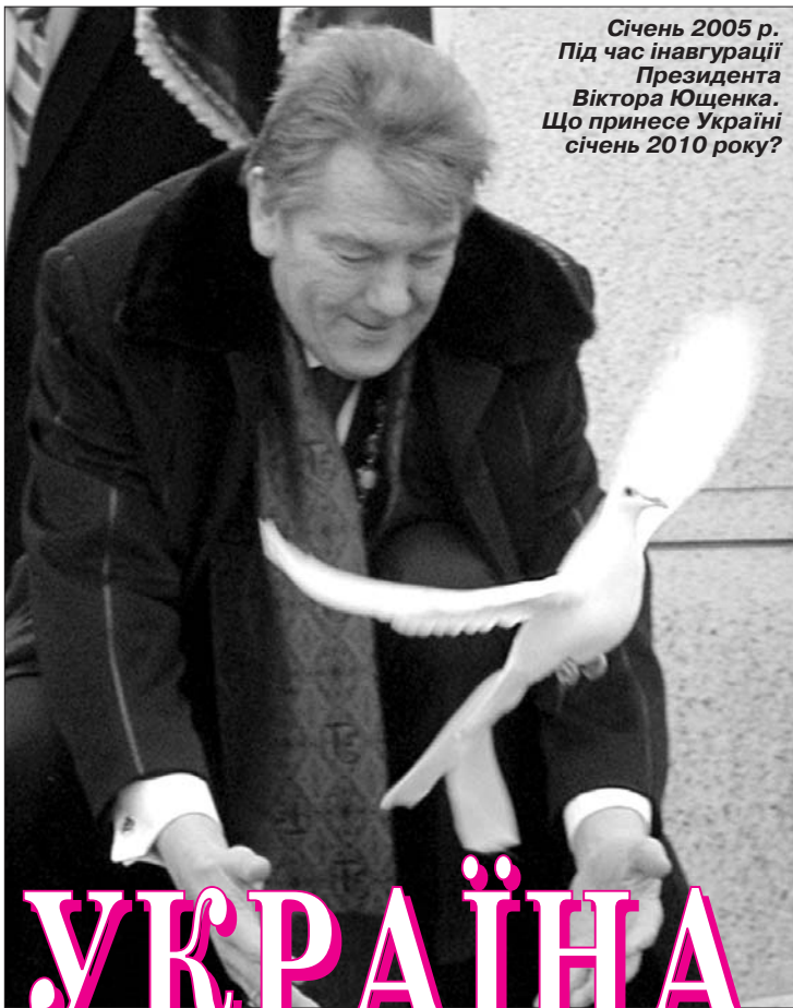
Січень 2005 р. Під час інавгурації Президента Віктора Ющенка. Що принесе Україні січень 2010 року?