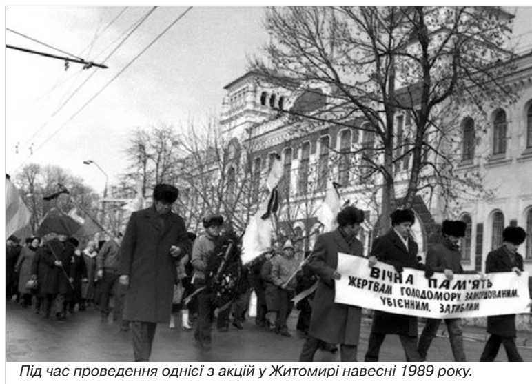
Під час проведення однієї з акцій у Житомирі навесні 1989 року.