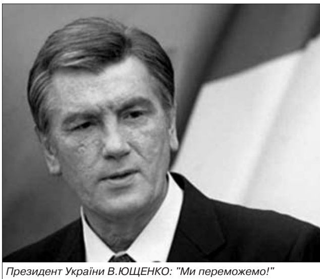
Президент України В.ЮЩЕНКО: "Ми переможемо!"

невдалими, ніж вдалими, а через низький рейтинг і стратегічні міркування, інші кандидати, крім Юлії Тимошенко, не вважають за потрібне активно боротися проти чинного Президента. Адаже для кожного з них вийти у другий тур з В.Ющенко вважається значно перспективнішим, ніж з активною та емоційною Ю.Тимошенко. Проте, чи не найважливішим сигналом, який різко піднімає шанси В.Ющенка взяти не лише свій електорат, а й частину електорату Ю.Тимошенко, який не наважиться голосувати за В.Януковича і не має довіри до нових кандидатів, є події, що демонструють можливість швидкого повного банкрутства Юлії Тимошенко: зупинка судом приватизації Одеського припортового заводу, істерія О. Турчинова та інших чільників команди Тимошенко з цього приводу, і нарешті відмова В.Путіна від жовтневої зустрічі з діючим прем'єром України. Якби Тимошенко мала авторитет, в інтересах російського прем'єра В.Путіна було демонстрування активних