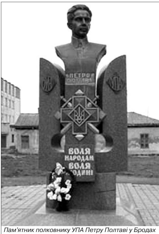
Пам'ятник полковнику УПА Петру Полтаві у Бродах

"Ми, українські революціонери і повстанці, боремося проти більшовицьких гнобителів, врешті, тому, що вони переслідують нас за наш патріотизм, за нашу любов до України, за те, що вони палять українські хати; руйнують господарства; вивозять на Сибір український народ; мурдують, спалюють живцем українських патріотів; відрізують жінкам груди; пробивають штиками дітей; розпинають на парканах, волочать по дорогах, прив'язавши колючим дротом коням до хвостів, наших впавших друзів-революціонерів; розривають їхні могили, викидають на смітники, у придорожні рови їхні тіла, де їх розшарпують собаки; ми боремося проти більшовиків тому, що вони деруть портрети Шевченка, Хмельницького, топчуть "Кобзаря", "Історію України". Усю Західну Україну більшовицькі бандити перемінили в одну жахливу м'ясорубку, немає тут сьогодні хати, де б ці душогуби когось не вбили, не заарештували, не вивезли на Сибір, немає ні ліску, ні гайку, де не виднілі б розриті повстанські могили, немає села, де не було б спалених, зруйнованих господарств, немає родини, де мати не оплакувала замордованого си-