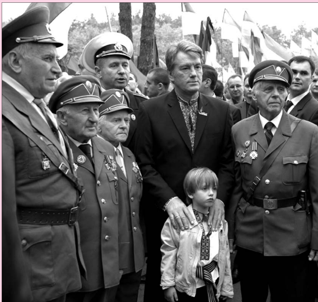
Президент України Віктор ЮЩЕНКО під час зустрічі з ветеранами УПА