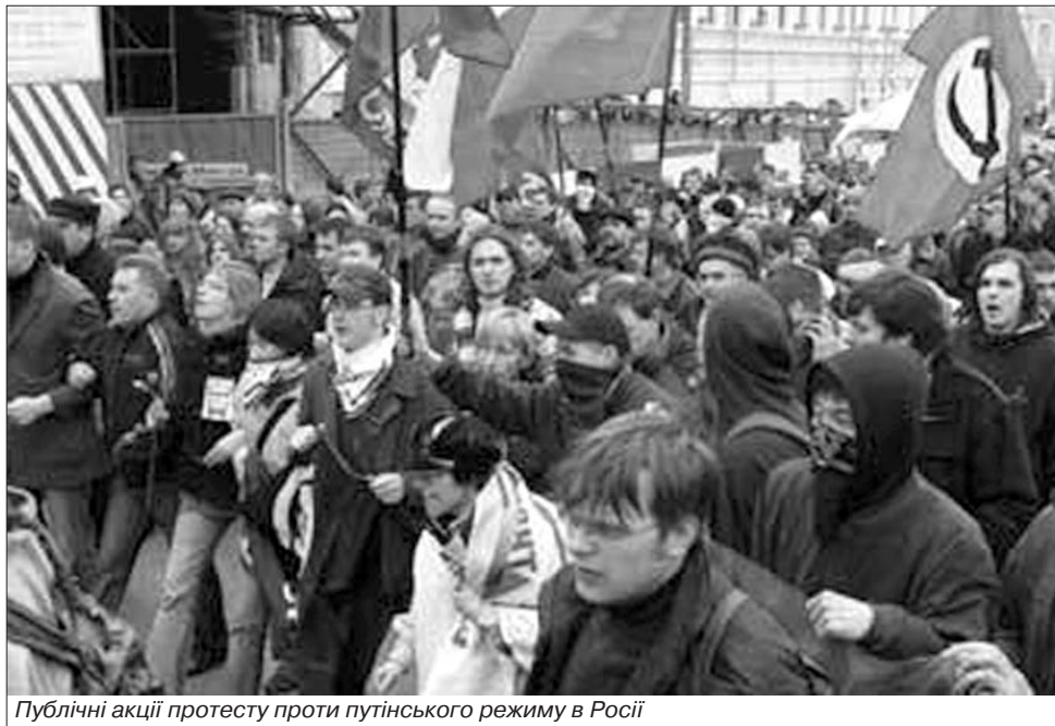
Публічні акції протесту проти путінського режиму в Росії

Російської Православної Церкви й Російської Православної Церкви за кордоном. Влаштуваючи довкола цих заходів гучні помпезності, російські можновладці замовчують факт обурення російською політичною еміграцією прирівнянням осіб, котрі боролися з комуністичним тоталітаризмом, до його сповідників та прислужників. Не повідомляють загал і про те, що сплановане російськими спецслужбами "возз'єднання" церков багатьма церковними ієрархами РПЦЗ так і не отримало визнання, оскільки насправді відбувається нахабне захоплення й привласнення церковного майна, створених російською антикомуністичною еміграцією духовно-культурних центрів і творення агентурної мережі. Заслугує особливий уваги й активізація роботи російських спецслужб у країнах Західної Європи. Однією з "перемог" російської розвідки є нещодавня заява польських урядових кіл про визнання пакту Молотова-Ріббентропа 1938 р. як змови між нацистською Німеччиною й комуністичним Радянським Союзом про поділ Поль-