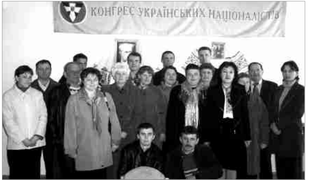
Макарівська районна організація Конгресу Українських Націоналістів, взаємодіючи з районним штабом коаліції „Сила народу”, під час Помаранчевої революції чимало зробила для перемоги Віктора Ющенка.