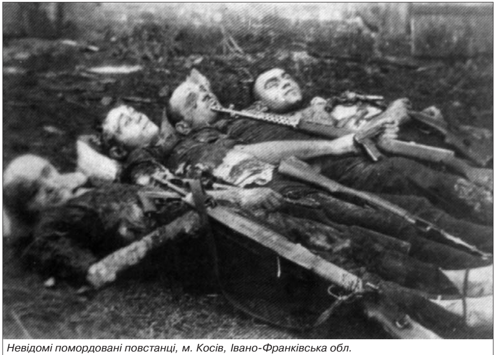
Невідомі помордовані повстанці, м. Косів, Івано-Франківська обл.

...Не згадуються з пам'яті нескінченні вервиці чорних, худих, обідраних, закутаних в лахміття жінок, дітей, дідів з південних областей України, де в 1946–47 рр. була засуха і панував голод. Ці бідні люди, чоловіки і сини яких були в Червоній армії, добиралися в Західну Україну