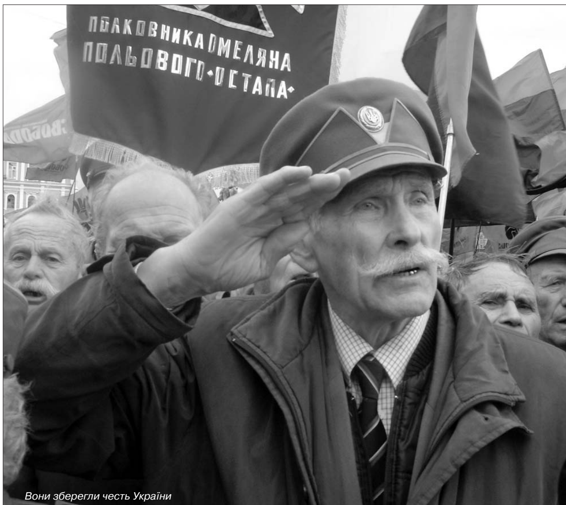
Вони зберегли честь України