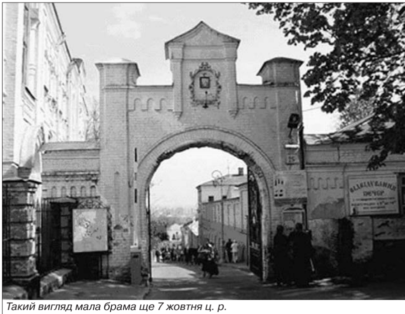
Такий вигляд мала брама ще 7 жовтня ц. р.

Для чого ченці Московської церкви вночі розібрали браму?