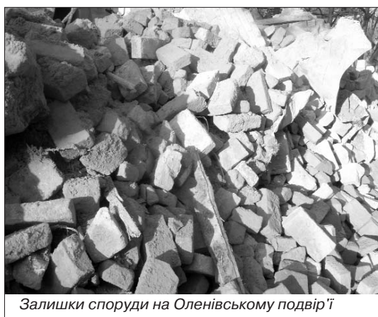
Залишки споруди на Оленівському подвір'ї

Натомість намісник Свято-Успенської Києво-Печерської Лаври вважає, що у руйнації брами винне керівництво національного Києво-Печерського історико-культур-