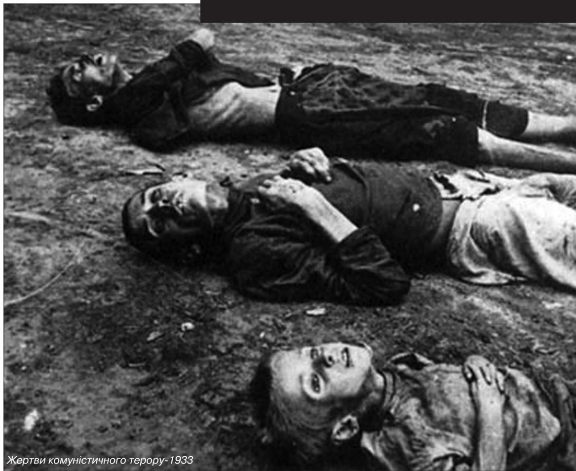
Жертви комуністичного терору-1933

3. Сім'я, в будинку котрої переховується бандит (тобто пограбований до нитки селянин), що насмілюється чинити будь-