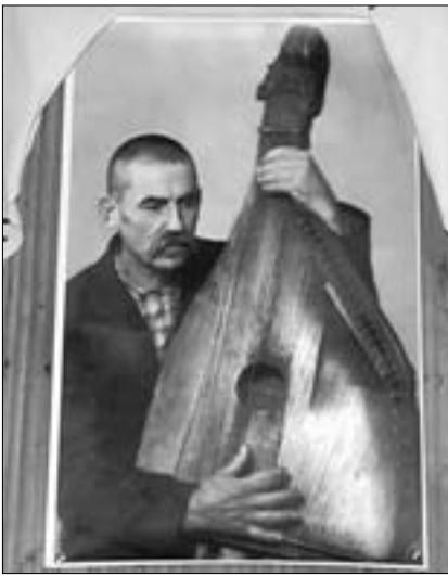
Автор цих рядків – народний кобзар Євген Адамцевич, 100-річчя від дня народження якого недавно відзначала громадськість Криму.

лоді, моряків ВМС України, родини і громадськості. Голова блоку Віктора Ющенка “Наша Україна” в Криму В. Пробий-Голова наголосив, що пісенна спадщина Є. Адамцевича виховує в нас патріотизм і любов до рідної землі. “Запорозький марш”, який нам подарував кобзар, - зазначив головний консультант представника Президента України в АР Крим В. Фесенко, - увів у зал засідань делегатів Першого з’їзду Руху і дотепер запалює наші серця і додає сил у розбудові незалежної України.”