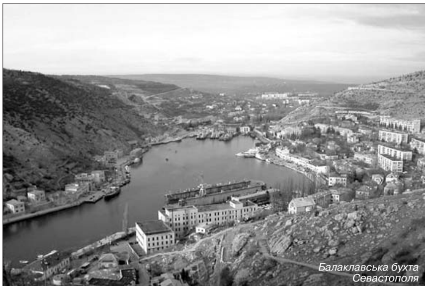
Балаклавська бухта Севастополя

Але задовго до цих подій у листопаді 1782 року із Херсона в бухту прибули фрегати "Хоробрий" №8 і "Обережний" №9 Дніпровської флотилії під командуванням капітана 1 рангу Одинцова, які вперше тут зимували. Взимку моряки обох фрегатів збудували спеціальну пристань для кліювання кораблів, очищення днища та бортів.