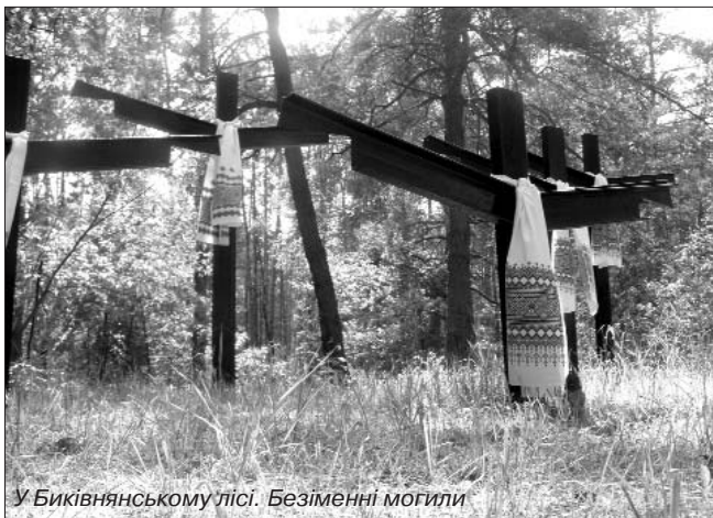
У Биківнянському лісі. Безіменні могили

У своєму виступі глава держави дав оцінку комуністичному режиму, який існував в Україні понад 70 років. "Злочинна комуністична влада, для якої нічого не значили не тільки людські права, а й сама людина, – сказав Президент, – жорстоко і цілеспрямовано нищила цвіт нашої нації. Кожен, хто вирізнявся талантом, в чий душі горів живий вогонь, першим потрапляв під налагоджену машину репресій. Любов до України, до рідного народу стала в ті часи найтяжчим із злочинів. Репресії проти українців почалися ще до 30-х років і продовжувалися навіть після розвінчання культу особи Сталіна".