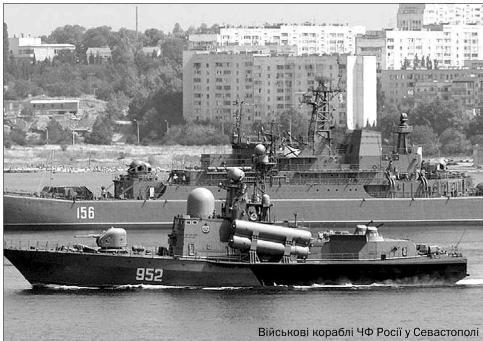
Військові кораблі ЧФ Росії у Севастополі

І лише усвідомлення обмеженості економічних, військових та зовнішньополітичних ресурсів Росії змушує її політиків "визнавати" Україну, і то до по-