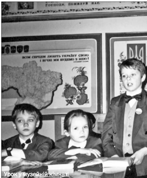
Урок у музейній кімнаті

Музей створювали з метою пропаганди знань з історії України, виховання патріотизму, любові до Вітчизни, залучення молодого покоління до вивчення та збереження історико-культурної спадщини свого народу, виховання освіченої, творчої особистості. А ще – сприяння відродженню й розбудові національної свідомості гімназистів, формування бажання у юнаків захищати свій рідний край у лавах українського війська, пов'язати свою долю з військовою професією.