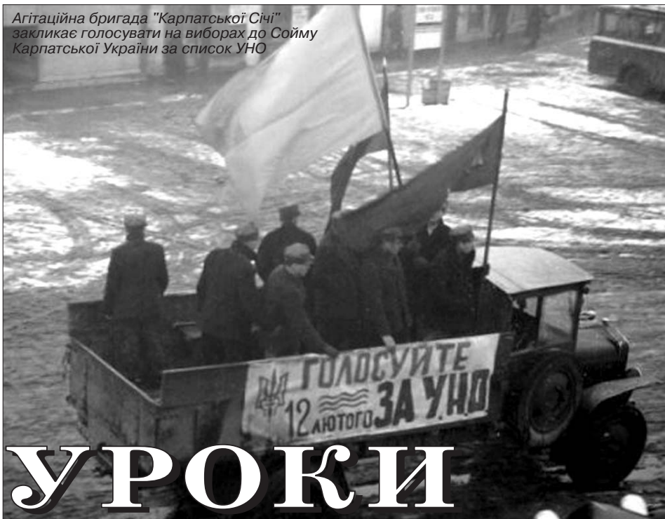
Агітаційна бригада "Карпатської Січі" закликає голосувати на виборах до Союму Карпатської України за список УНО