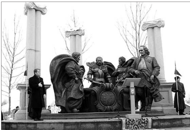
Президент України В.ЮЩЕНКО під час відкриття історично-меморіального комплексу в Батурині

Тільки нації з чіткою самоідентифікацією, плеканою культурою можуть бути економічно та політично успішними