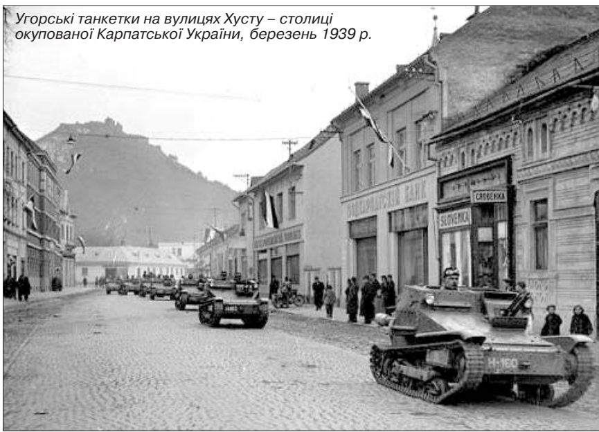
Угорські танкетки на вулицях Хусту – столиці окупованої Карпатської України, березень 1939 р.

Саме завдяки рішучим організаційним і пропагандистським заходам, що здійснювалися зусиллями Проводу Українських Націоналістів (під орудою спочатку полковника Євгена Коновальця, а після його трагічної загибелі у Роттердамі, – полковника Андрія Мельника), серед світової української діаспори розпочався збір коштів для оборонців Карпатської України. У жовтні 1938 р. українська громада США передала для потреб Карпатської України 1152 долари. Американських українців підтримали українці Франції, що направили до Хусту 80.000 франків фінансової допомоги. Не залишилися осторонь й ветерани Української Стрілецької Громади у Канаді, котрі надіслали до Закарпаття 5.200 доларів США. У відпо-