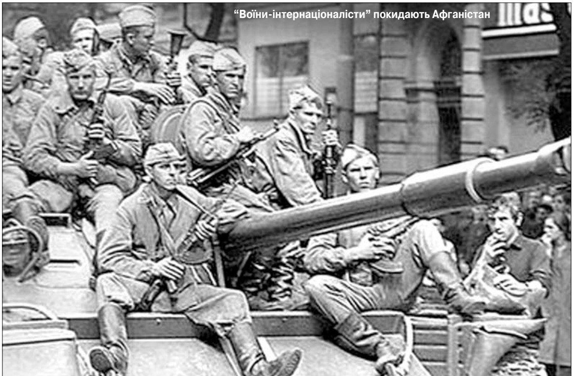
"Воїни-інтернаціоналісти" покидають Афганістан