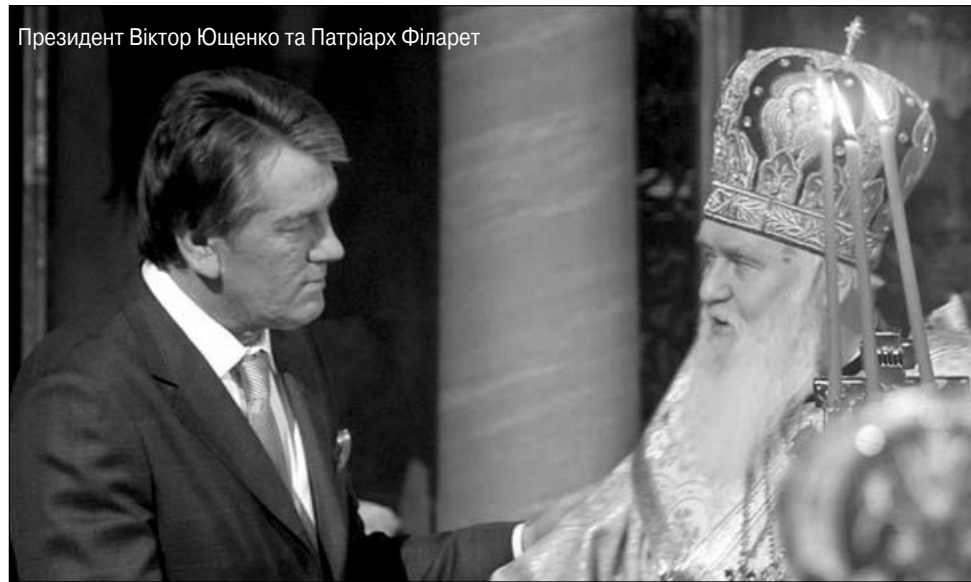
Президент Віктор Ющенко та Патріарх Філарет

леко не останню роль, якщо не головну. Як приклад, наведу висловлювання Патріарха Кирила: "Я не вважаю себе на Україні іноземцем"; "Росія, Україна, Беларусь – это Святая Русь"; "Київ – южная столица русского православия". Як вам таке? Тож доводиться з прикриття констатувати, що Кирило є лише однією зі складових загального російського плану щодо повернення, як вони вважають, свого, втраченого. Отже, він дещо лукавить, коли каже, що його візит – лише пастирський.