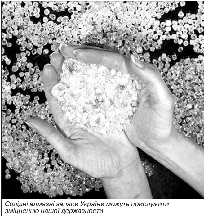
Солідні алмазні запаси України можуть прислужити зміцненню нашої державності.

ками, а може і сотнями кімберлітових трубок, заповнених алмазоносною породою. Ми ці алмази видобули кустарним способом під час практики в різних областях України. Ти мабуть і не чув, що один із найбільших алмазів у світі "Мазепа" знайшов на Українському щиті петлюрівський офіцер, за фахом геолог. У нас найбільша у світі кількість алмазів. Біля села Скоморошки в Вінницькій області знаходиться найбільша з виявлених у світі кімберлітових трубок діаметром аж 6,5 км. – То чому ж їх не видобувають? – не вгавав я. – Молодий ще ти дуже, щоб це знати, – відрубав Сергій Амвросійович, зачинаючи дверцята сейфу.