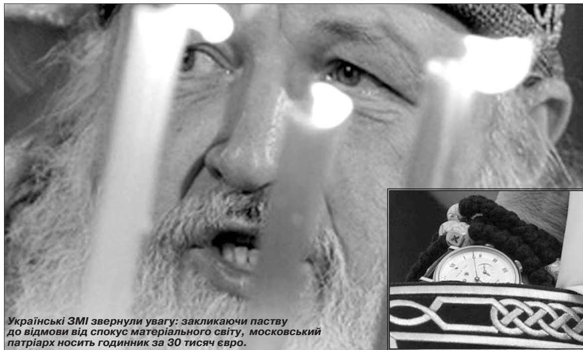
Українські ЗМІ звернули увагу: закликаючи паству до відмови від спокус матеріального світу, московський патріарх носить годинник за 30 тисяч євро.

довжується й сьогодні. Ще перед проголошенням незалежності український народ не припиняв боротьби за своє визволення і за своє право повернення Патріархальної Помісної Церкви. Проте посткомуністична система і навіть самі комуністи почали утворювати збурення, щоб утвердити Російський Патріархат в Україні як єдину церкву. Що цікаво, що комуністи почали створювати нову релігію, яка б підтримувала імперські амбіції Росії. Як зрозуміти, що РПЦ, яка хоче стати третім Римом, не дозволяє нації і державі мати свою Помісну Православну Церкву? Відомо, що в цей період у Європі утворено 15 молодих церков, які отримали свою автокефалію і незалежність. А українська церк-