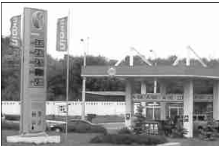
ЄЕП однозначно вигідний Росії, це її політичний і економічний вигравш і перемога над Україною.

Ще не встигли москвофіли у Верховній Раді ратифікувати договір про так званий ЄЕП, як Москва розпочала демонстрацію того, що ж це таке на практиці. Російські нафтові фірми, що володіють усіма нафтопереробними заводами України, в черговий раз вирішили збагатитися за рахунок українців. Всупереч усім статтям договору про ЄЕП, де йдеться про зону вільної торгівлі, російські магнати підняли ціни на бензин до небес. У Росії для російських споживачів вони такого не роблять. Але подорожчання пального – це початок подорожчання всіх товарів і послуг. Російські нафтобарони поводяться так нахабно, тому що знають, - Україна не має інших джерел постачання енергоносіїв. Прихід каспійської нафти в Україну блокується п'ятою колоною Москви, це угруповання в системі нинішньої влади постійно намагається заблокувати роботу нафтопроводу „Одеса-Броди” і передати його тим-таки російським фірмам. Отже, восени на нас чекає стрімке зростання цін як перший наслідок ЄЕПу. Це розуміють і в оточенні де-