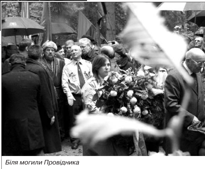
Біля могили Провідника

родні, стрілецькі та повстанські пісні, зокрема марш ОУН "Зродились ми великої години".