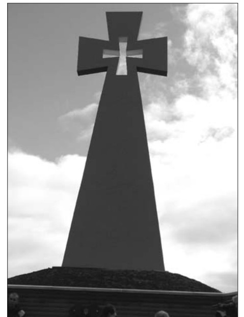
Пам'ятний козацький хрест на Мазепиному кургані