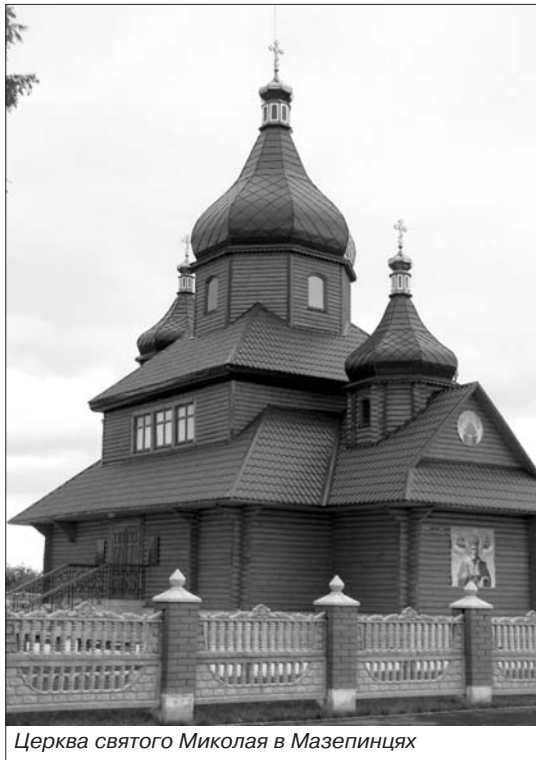
Церква святого Миколая в Мазепинцях

До 370-ї річниці від дня народження вшанували Івана Мазепу